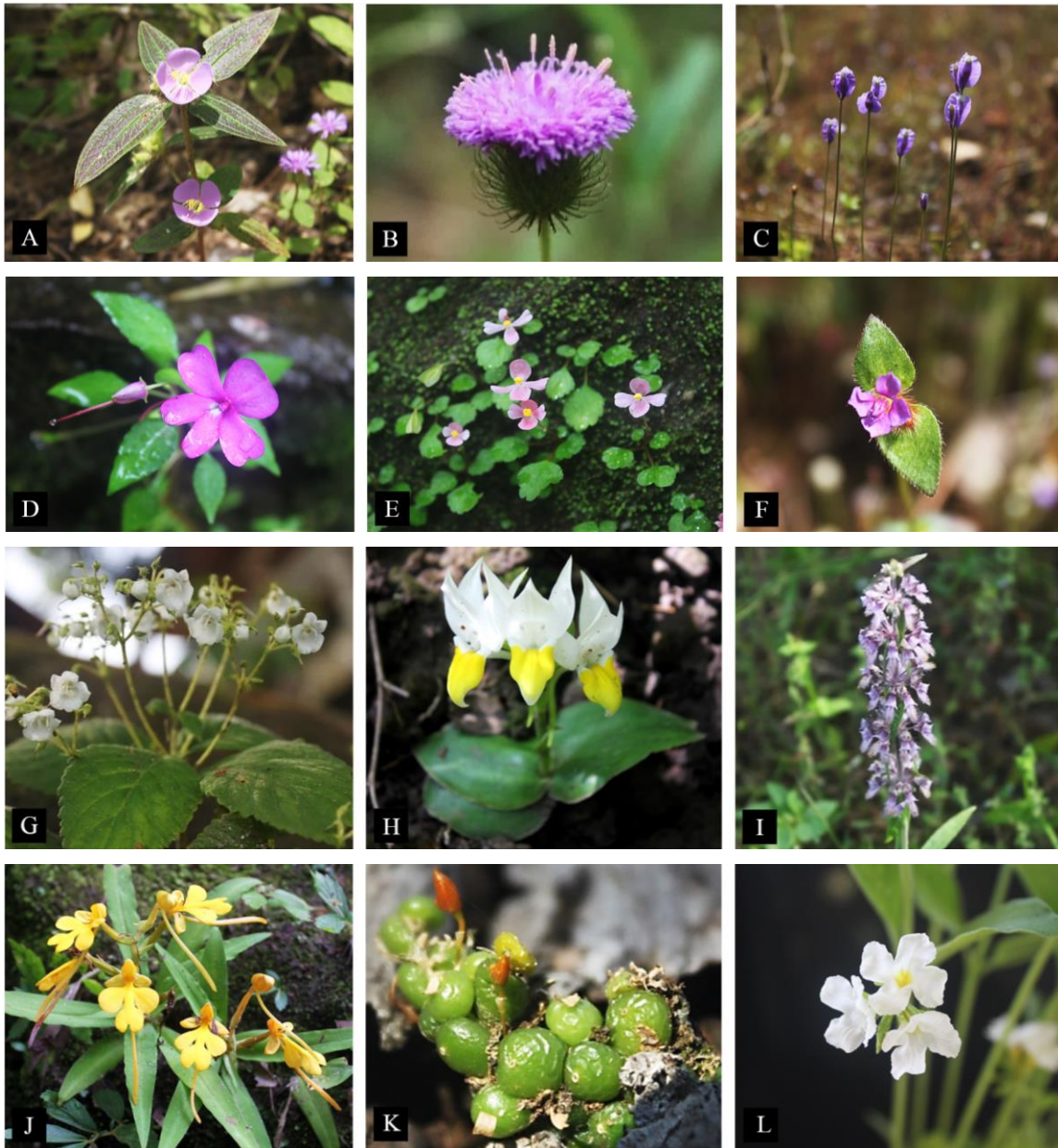
Figure 2 Flowering herbs plant in Phu Sri Tan Wildlife Sanctuary. A) Osbeckia Setoso – annulata ; B) Camchaya spinulifera ; C) Burmannia coelestis ; D) Impatiens noei ; E) Begonia hymenophylla ; F) Osbeckia cochinchinensis ; G) Kaisupeea cyanea ; H) Pecteilis hawkesiana ; I) Platostoma Fimbriatum ; J) Habenaria rhodocheila ; K) Bulbophyllum moniliforme ; L) Dimetra craibiana

จากการศึกษาพบว่าพืชที่สำรวจพบนี้จัดเป็นพืชถิ่นเดียว (Endemic species) ถึง 6 ชนิด ได้แก่ Camchaya spinulifera (Forest Herbarium,